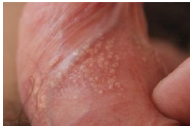
opryszczka warg sromowych – zdjęcia: