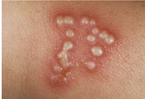
opryszczka na penisie – zdjęcia: